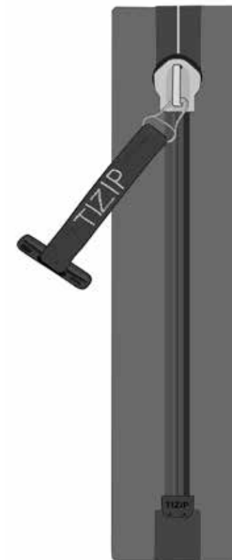
Séparable d'un côté /1 curseur