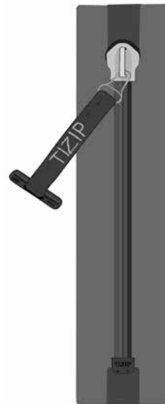
Fermée des deux côtés /1 curseur